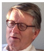
BISKOP EM. FINN WAGLE