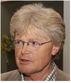
BISKOP EMERITUS TOR B. JØRGENSEN